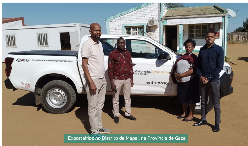
ExportaMoz no Distrito de Mapai, na Província de Gaza

Situado a apenas três horas do Porto de Maputo, por estrada totalmente transitável e com acesso à linha