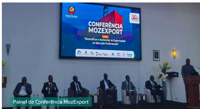
Painel da Conferência MozExport

tações nacionais, identificar sinergias futuras no contexto da dinamização do comércio externo e apoio às micro, pequenas e médias empresas (MPMEs).