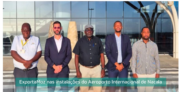
ExportaMoz nas instalações do Aeroporto Internacional de Nacala

O objectivo é dinamizar o sector de carga aérea para exportação, aproveitando a capacidade instalada do aeroporto -