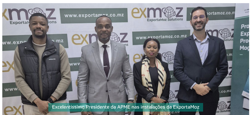
Excelentíssimo Presidente da APME nas instalações da ExportaMoz

Durante o encontro, foram identificadas sinergias para capacitação empresarial, acesso a mercados e soluções financeiras ajustadas às necessidades das Pequenas e Médias Empresas (PMEs) moçambicanas. A parceria reforça o compromisso de