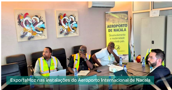
ExportaMoz nas instalações do Aeroporto Internacional de Nacala

No âmbito da missão à Província de Nampula, a ExportaMoz reuniu-se com a Direcção do Aeroporto Internacional de Nacala para avançar com a implementação do Memorando de Entendi-