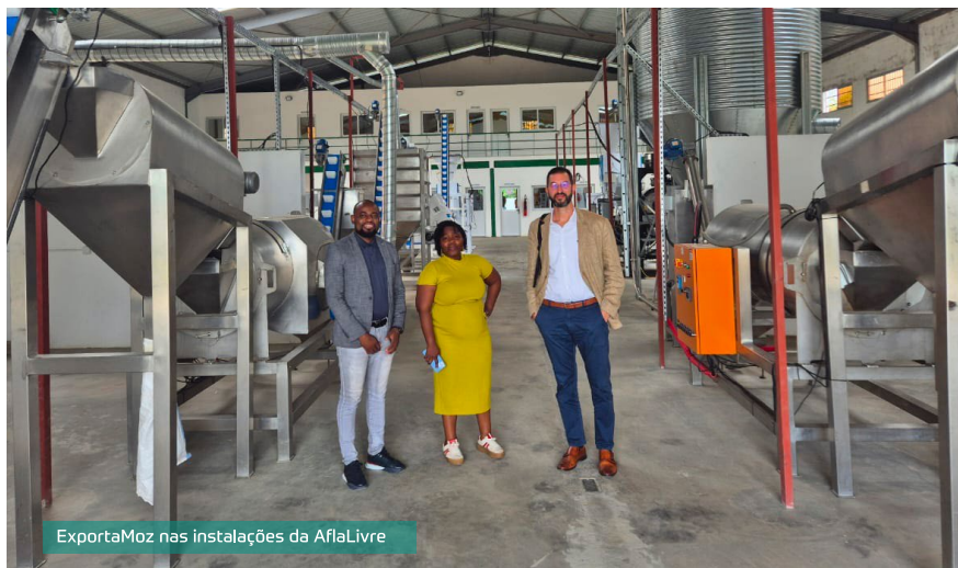
ExportaMoz nas instalações da AflaLivre

Para a ExportaMoz, a AflaLivre destaca-se como um ponto de convergência entre ciência, agricultura e impacto social. A visita contou com a participação da TechnoServe e da Associação Moçambicana para Promoção do Cooperativismo Moderno (AMPCM), parceiros relevantes neste esforço de valorização da produção local.