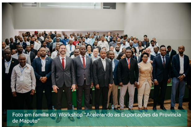
Foto em família do Workshop “Acelerando as Exportações da Província de Maputo”