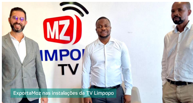
ExportaMoz nas instalações da TV Limpopo

A ExportaMoz reconheceu durante a visita realizada no mês de Maio, às instalações da TV Limpopo, o papel relevante que a televisão vem desen-